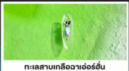
ทะเลสาบเกลือดาเอ๋อร์อัน