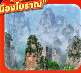
"คุบเขาอวดตาร"