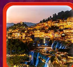
"เมืองโบราณฟูหลงเจิน"