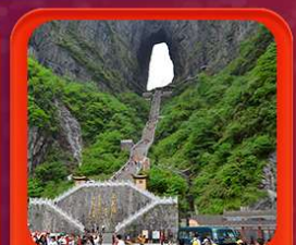
"ถ้ำประตูสวรรค์"