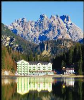
ทะเลสาบมิลูร์น่า