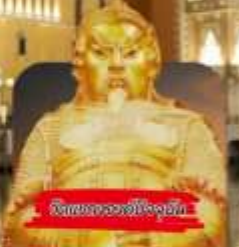
วัดของมาเก๊า