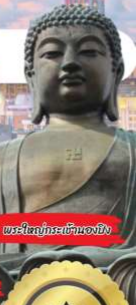
พระใหญ่กระเช้านองยง