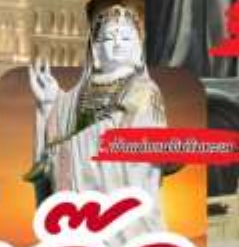
วัดของมาเก๊า