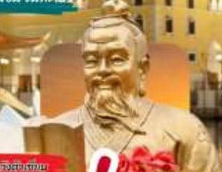
วัดของงกก