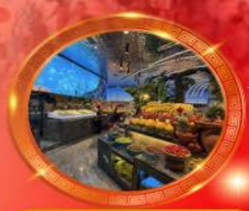
บุฟเฟต์หม้อไฟลงชิง