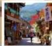
หู่ป๋านปลาซ่า