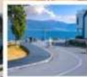
ทะเลสาบ 5 กม. ด้าหลี่