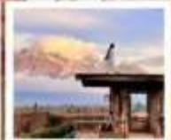
YUN DI AN CAFE