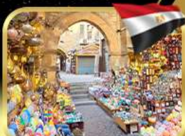
ตลาดชานอลคาลิลี