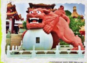
วัดเขวียนหวู