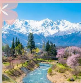
"HAKUBA OIDE PARK"