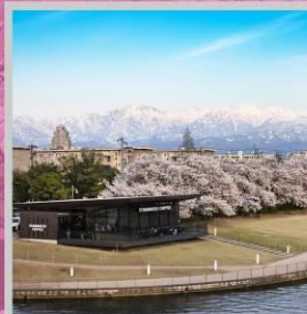
"TOYAMA KANSUI PARK"