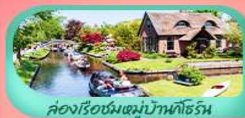
คลองเรือชมหมู่บ้านทีฮอร์น