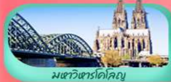
มเซวี่ซาร์โคโลญ