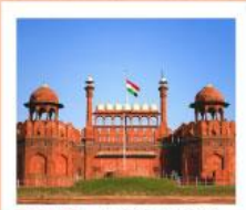
♥♦♦ Agra Fort