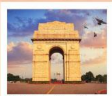
♥♦♦ India Gate