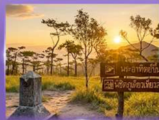
ชมพระอาทิตย์ขึ้น กุสอยดาว