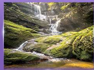
น้ำตกสายทิพย์