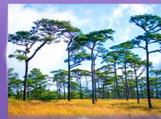
ลานสนกุสอยดาว