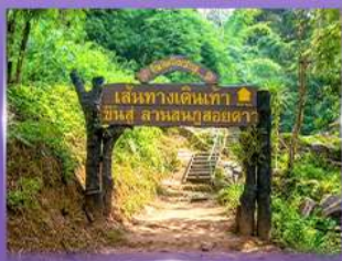
พีช 5 เป็นวัดใจ