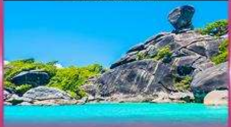
ทัวร์เกาะสิมิลัน