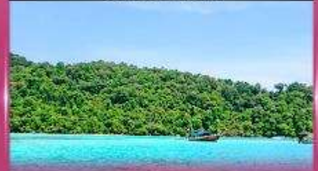
ทัวร์เกาะสุรินทร์