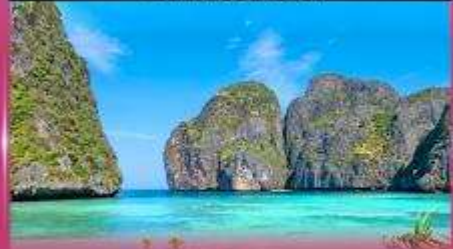
ทัวร์เกาะพีพี