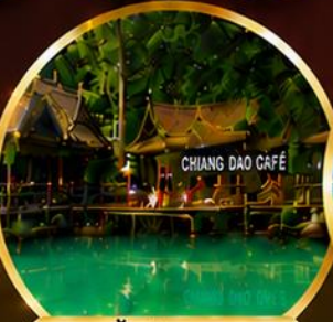
ท่าช้างผดุง