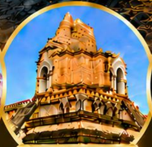
วัดเจดีย์หลวงวรวิหาร