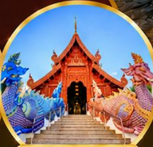
วัดเด่นสะหสิศรีเมืองแกม