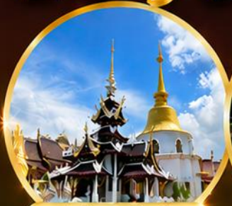
วัดป่าดาราภิรมย์