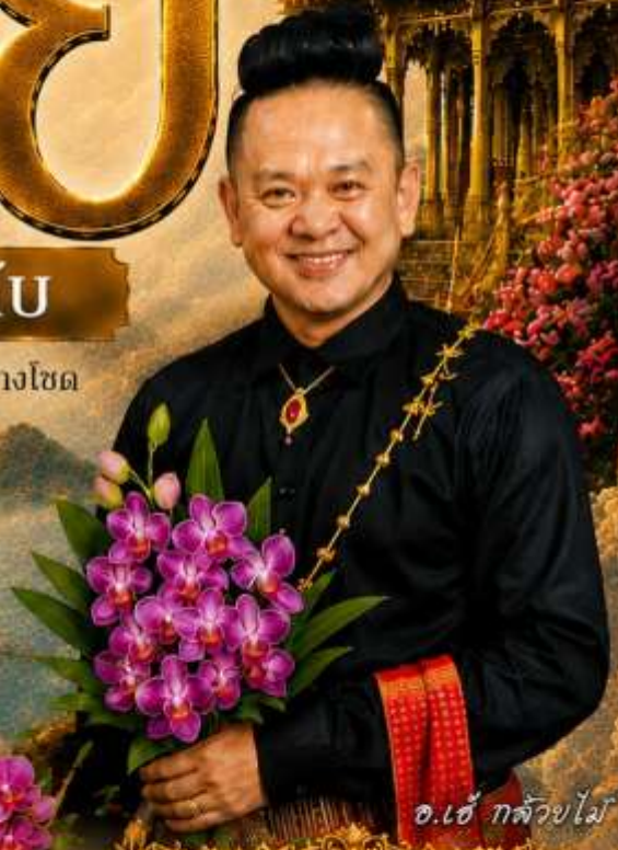
อ.อ๋อ กล้วยไม้

เสริมโชคลาภ การงาน การค้า เปิดทางรวย เงินทองไหลมา